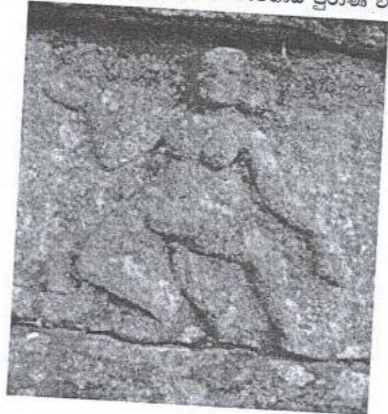
ඡායාරූප 09 - නාට්‍යාංගනාව -ගණේගොඩ පුරාණ විහාරය