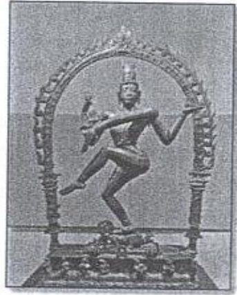
ආයාරූප 03 - ලෝකඩ නටරාජා රූපය

දැනට ලැබී ඇති විශාලම ලෝකඩින් කල නටරාජා රූපය පොළොන්නරුව ශිව දේවාල අංක 02න් සොයාගෙන තිබේ. අඩි 4 අඟල් 3/4 ක් පමණ උස ප්‍රතිමාවක් වන මෙය ක්‍රි.ව 11වන සියවසට අයත් යැයි සැලකේ. කවාකාර ප්‍රභාමණ්ඩලයක් මැද පද්මාසනයක් මත හිඳින ආකාරයට නිර්මාණය කර ඇති නටරාජා රූපය ඉදිරියේ සංහිත කණ්ඩායමක් නිරූපණය කර ඇත. එහි දකුණේ සිට වමට තාලම් වයන ස්ත්‍රියක් සහ පුරුෂයෙක් දැක්වේ. 16 (ආයාරූප 03)