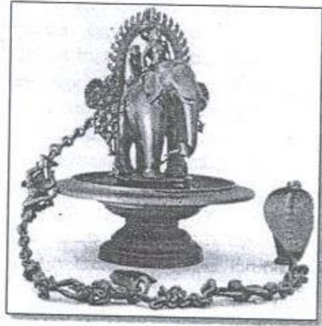
ඡායාරූප 01 - දැදිගම ඇත්පහන

යන දෙදෙනා ම නාට්‍යංගනාව මෙන් කකුල් දණ හිස ලඟින් නැමී වම් විලුඹ පොලොවෙන් ඉස්සි තිබෙන ඉරියව්වකින් සිටී. ඒ අනුව ඔවුන් දෙදෙනා ද නාට්‍යංගනාව සමඟ ඇයව අනුරූපව පාද තබමින් ගමන් ආකාරයක් හඳුනාගත හැකි ය. (ඡායාරූප 01,02)