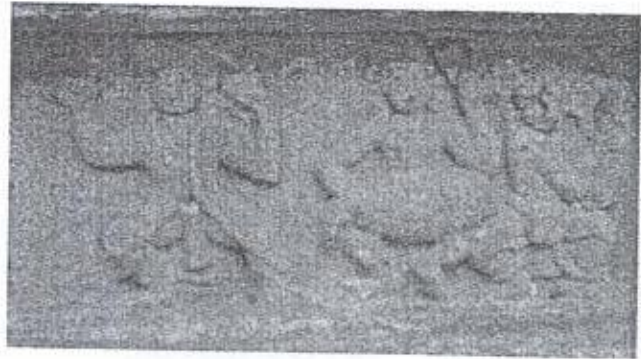
ඡායාරූප 07 - නාට්‍යාංගනාව සහ වාදකයෝ ගඩලාදේණිය විහාරය

රූ කම් ගණනාවක් ...යේ ද පිහිටි ප්‍රධාන ...නැටුම් පෙන්නුම් ...නර්තනයේ එක් ...නිර්මාණය කර ...නළඟන රූපය ...පිළිබඳ ව ...නැමි වම් අත වම් ...ගෞලියක හස්ත ...වලින් යුත් අංග ...මෙම නළඟන ...කැටයම් අතර ...කුළින් රචන් කාල (ඡායාරූප 06)