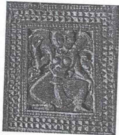
ඡායාරූප 06 - නළඟන රූපය - ඇම්බැක්ක දේවාලය

හා නර්තන අශ්‍රිත විවිධ අංග ප්‍රකට කරවන රූ කම් ගණනාවක් දැකිය හැකි ය. දේවාලයට ඇතුළුවන ස්ථානයේ ද පිහිටි ප්‍රධාන බාල්කය මත පැරණි ජන නැටුමක් වූ ලී කෙළි නැටුම පෙන්නුම් කරන කැටයමකි. දැනට ගන්නා ලද ලී සහිතව නර්තනයේ එක් ඉරියව්වක් ප්‍රකට කරවන ආකාරයට කැටයම නිර්මාණය කර තිබේ. ඇම්බැක්ක කැටයම් අතර දක්නට ලැබෙන නළඟන රූපය ද මෙම යුගයේ වර්ධනය පැවති නර්තන සම්ප්‍රදායක් පිළිබඳ ව අනාවරණය කරයි. නාට්‍යංගනාව දණහිසින් නැමී වම් අත වම් දණ හිස මත තබා දකුණතින් ඉන්ද්‍රිය නර්තන ශෛලියක හස්ත මුද්‍රවක් දක්වමින් සිටී. භාරත නාට්‍ය පාද ප්‍රයෝගවලින් යුත් අංග ප්‍රත්‍යංග මෙරට නර්තනයට මිශ්‍රව පැවති බවට මෙම නළඟන රූපය පැහැදිලිව ම සාධක සපයයි. එසේ ම මෙම කැටයම් අතර දක්නට ලැබෙන රඹන් වයන්තාගේ කැටයම තුළින් රඹන් තාල අනුව සිදුකරන රංගනයක් නිරූපණය කරයි. (ඡායාරූප 06)