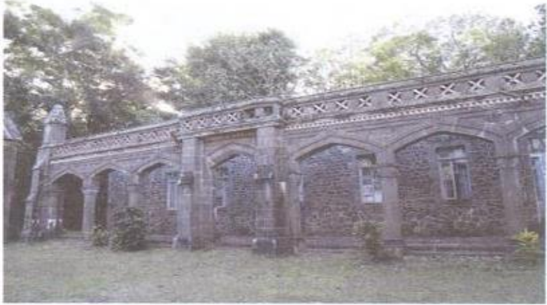
01. ඡායාරූපය - කන්ද උඩරට සිරකරුවන් මුර්සි දිවයිනේ තේවාසික ව සිටි ගොඩනැගිල්ල (වර්තමාන තත්ත්වය)

1818 නිදහස් සටන අවස්ථාවේ දී බලහත්කාරයෙන් මහනුවරින් පිටමන් කරනු ලැබ කොළඹ කොටුවේ නිවාස අඩස්සියේ වසර හතක් කිසිදු වෝදනාවක් නොමැති ව සිරකර තැබූ ඇහැලේපොල මහ නිලමේ ද 1825 මැයි මස 14 දින ඇලෙක්සැන්ඩර් නොකාවෙන් මුර්සි දිවයිනට පිටුවහල් කිරීම දෙවොපගත සිදුවීමකි. මෙහෙකරුවන් තිදෙනෙක් ද තෝල්කයෙක් ද ඔහු සඳහා රැගෙන ගියත්, මෙහෙකරුවන් අතරින් එක් අයෙක් ද තෝල්කයා ද ඔහුගේ මෙහෙකරු ද ඔවුන්ගේ ඉල්ලීම පරිදි මාස දෙකකට පසු පෙරළා ලංකාවට පැමිණ ඇත. 30 පෝට් ලුවීසි සිට සැතපුම් හතක් ද පවුඩර් මිල්ස් පරිශ්‍රයේ සිට සැතපුම් එකහමාරක් දුරින් පිහිටි පැමිප්පමුස් ගම්මානය මුර්සියේ දී ඇහැලේපොල නිලමේගේ ස්ථිර වාසස්ථානය විය. 31 වසර හතරක් මුර්සියේ දිවිගෙවූ ඔහු ද 1829 අප්‍රේල් මස 05 වන දින මරණයට පත් විය. 32 තම මළ සිරුර ආදාහනය කරන ලද ස්ථානයේ තම පෞද්ගලික අරමුදල්වලින් වියදම් දරා සොහොනක් ඉදි කරනු ඇතැයි ඇහැලේපොල නිලමේ අපේක්ෂා කර තිබුණි. 33